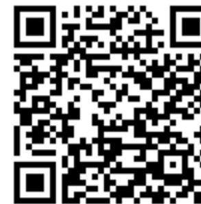
Google Play Store